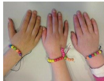
Iedereen een armbandje

De armbandjes voor kinderen die ziek waren vorige week, worden door Oepsie bewaard in de mand bij de directiekamer.