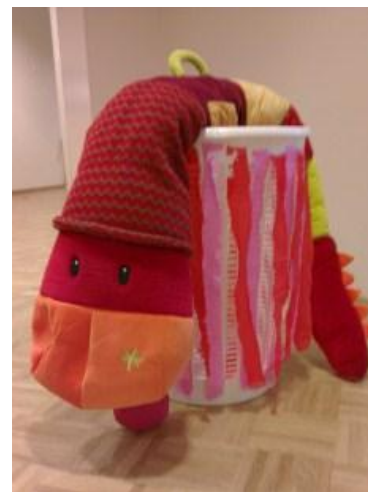
Oepsie en de mand met enveloppen