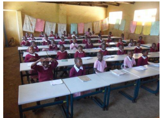
Leerlingen van de Mirera Primary School zijn blij met hun nieuwe meubilair.

Komen die groene poten onder die grijze tafelbladen u bekend voor? Dat klopt! De oude tafeltjes en stoeltjes hebben een prachtige nieuwe bestemming in Kenia gevonden. Mooi toch?