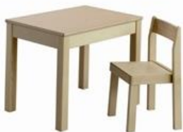
Nieuwe tafels en stoeltjes voor groot en klein

Mmm... die gaat alvast een lesje over teleurstellingen voorbereiden!