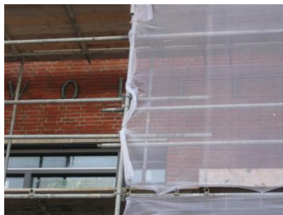
De letters op de gevel

Afgelopen week is een kleine delegatie van het team op kijk-bezoek geweest in de nieuwbouw en hoewel het nog duidelijk een kwestie van ‘er doorheen kijken’ is, willen we u een sfeerimpressie niet onthouden.